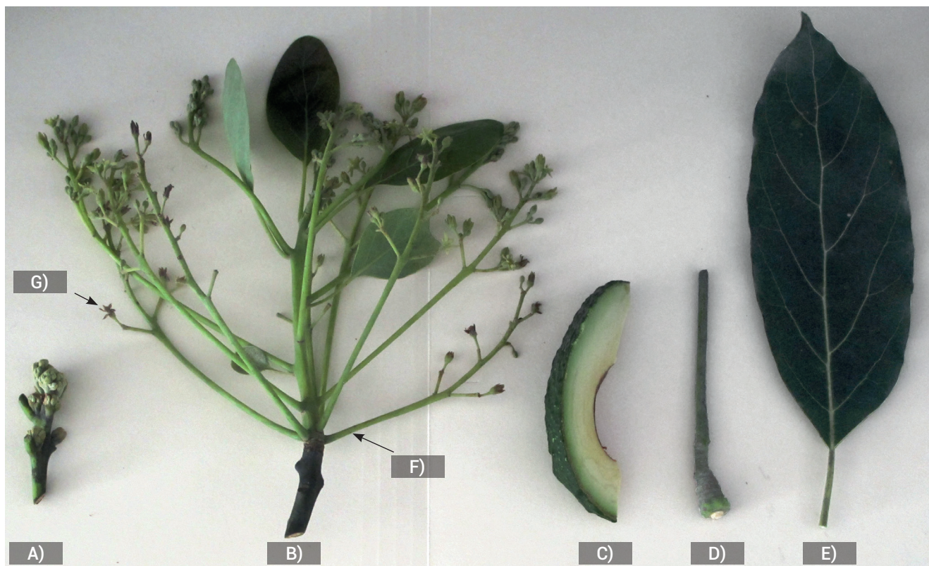
Figura 1. Órganos y sus partes usados para determinar las concentraciones de Zn y B en árboles de aguacate Hass. A) Inflorescencia en estado "coliflor" (apertura de las brácteas de la inflorescencia, la inflorescencia empieza a emerger); B) Inflorescencia completa en anthesis; C) Pulpa del fruto; D) Pedúnculo + pedicelo del fruto en madurez fisiológica; E) Hoja; F) Raquis de la inflorescencia en anthesis; G) Flores en anthesis.

kg -1 , comparado con el testigo, que en los mismos tejidos presentó 75.3 y 21.5 mg kg -1 , respectivamente. Al igual que en Zn, ambos resultados permitirán realizar diagnósticos tanto en anthesis como en la cosecha del fruto. Razeto y Castro (2007) determinaron que el análisis del pedúnculo y pulpa del fruto fueron los mejores indicadores de la concentración de B; sin embargo, en el estudio aquí presentado la pulpa del fruto no fue un indicador adecuado.